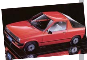
1983年 マイティボーイ