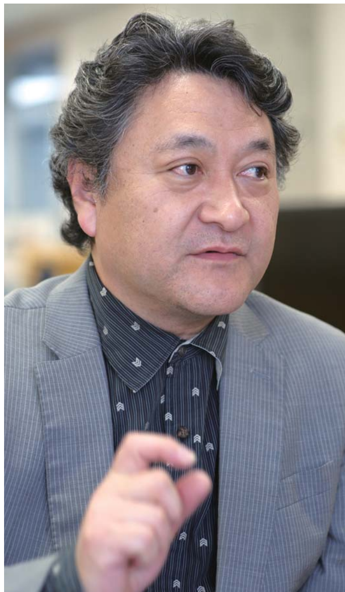
現在のクルマは端境期にあるという。「電気自動車 came ときに、どうなるかというのを楽しみますね」