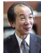
長時間にもかかわらず、すこしも疲れも見せず、非常にエネルギッシュな方でした。あくまでもソフトな語り口ですが、ときには歯に衣着せぬ発言が痛快です。トランペットについては「時間がなくて、練習できないんですよ。本来は、そこを一番大事に考えなきゃいけないんですけど、一番後回しになってまして、困りますね」と少々ぼやいていたのが印象的でした。

共に頑張って前進しましょう。日本でも有数のブランドの芸術系の大学にしていきたいです。作家、音楽家、先生・保育士を目指す学生が集まる大学に、入りたいといわれる大学にしていきたいです。それを見て、卒業生も教職員も、甘んずることなく切磋琢磨しあうような、良い循環を生むような。必ずやできると思います。共に前進しましょう。