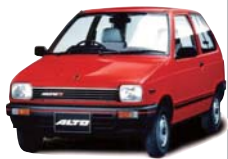
1984年 アルト(2代目) Japan Best Car Design Award 大賞

2~5代目まで、歴代のアルトを担当。「一番安くて、確実に売らな きゃいけないクルマ。数を 売るのが難しい、プレッ シャーはすごいですよ。」