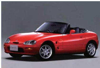
1991年 カプチーノ グッドデザイン賞受賞 Auto Design92 デザイン大賞 Auto Design92 スポーツカー部門賞