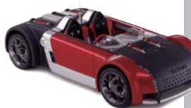
2001年 GSXR-4 東京モーターショー ショーモデル