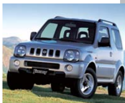
1998年 ジムニーワイド グッドデザイン賞受賞 Off Road and 4Wheel Drive Magazine Best 4x4 OF THE YEAR