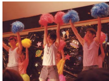
西キャンパスの様子