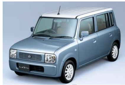
2002年 ラバン ラバンを作ることで、自分 の意識も大きく変わった。 「モノに対してどれだけ精神 性が盛り込めるかというこ ころがね、まだまだかなと 思っています。もうちょっと 愛着の持てる、可愛がり たくなる魅力、そういうも のが出てくるといいと思 います。」