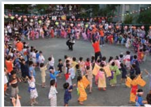
夏まつり盆踊り大会