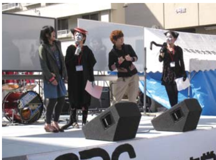
東キャンパスの様子

西 キャンパス 今年のテーマは「アラタ」 「アラタ」とは漢字で「新(しん)(あたらしい)」と書きます。また、それぞれの頭文字を取ると、「A・R・T」で「アート」になり