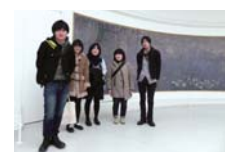
オランジュリー美術館