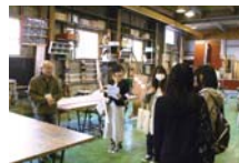
木工房では作業内容や機器の使い方をレクチャー