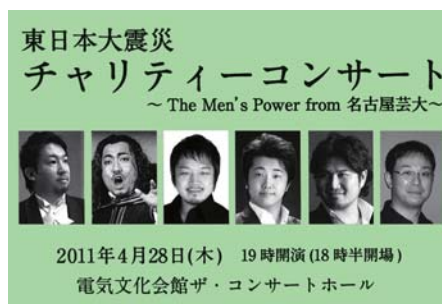
東日本大震災チャリティーコンサートに出演した 本学OBの皆さん

被災地の保育園・幼稚園・施設などの子どもたちに送るための玩具やお絵かき帳、絵本や童話などを収集したり、オリジナルなおも