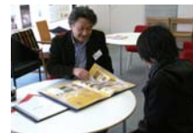
持参作品の評価は良くも悪くも嬉しいもの