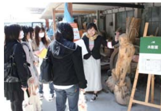
木工工房では制作途中の作品がお出迎え?

学部イラストレーションコース卒業生堀越耕平さんの作品。実はこの堀越さん。在学中にあの超人気マンガ誌の週刊少年ジャンプに読切りが掲載され、卒業後は連載をスタートさせて注目を集める人気マンガ家です。この堀越さんも、名古屋芸大のキャンパスでアートやデザインを学び、夢をカタチにした1人。今回のオープンキャンパスでもサポートスタッフとして、未来の名古屋芸大生のためにお手伝いをしてくれました。このトートバッグは堀越さんのファンにとっては宝物ですね。堀越さん以外にも、名古屋芸大の卒業生にはアートやデザインの世界で活躍する方が大勢います。例えば、人気アニメのメカデザインで有名な山下いくとさんも名古屋芸大OBの1人。そんな先輩たちに支えられる名古屋芸大で、未来のアーティストを目指してはいかがでしょうか。