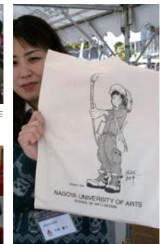
人気マンガ家堀越さんイラストのオリジナルトートバッグ