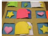
人間発達学部生による 手づくりおもちゃ