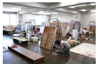
制作中の在校生を日本画アトリエで発見! こういう姿に憧れる