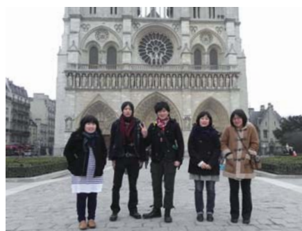
ノートルダム大聖堂