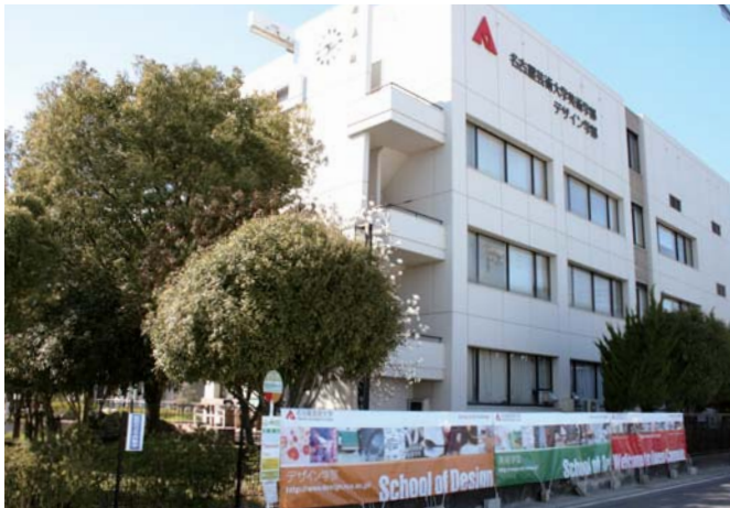
歓迎ムード満点の西キャンパス正門