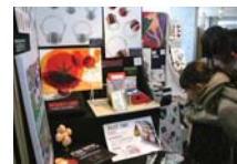
デザイン学部1年生の選抜作品に思わず唸る。上手い!