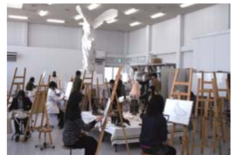
美術学部「デッサン講習会」。モチーフは静物や石膏、モデルから選択