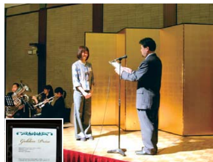
2009年10月、本学音楽学部同窓会より卒業後も活躍している卒業生に送られる『ゴールドンプライズ賞』を受賞。

30歳まで頑張ってみて、頭を下げなければ仕事来ないようなら辞めよう、そんな覚悟で始めた仕事だが、30歳にな