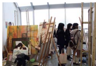
隠れ家みたいな洋画アトリエは想像力が膨らむ