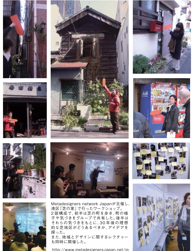
Metadesigners network Japanが主催し、港区「芝の家」で行ったワークショップ。2部構成で、前半は芝の町を歩き、町の様子や気づきをグループで共有した。後半はそれらの気づきをもとに、30年後の理想的な芝地区がどうあるべきか、アイデアを探った。また、地域とデザインに関するレクチャーも同時に開催した。