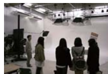
初めて見る撮影スタジオに参加者一同ビックリ!