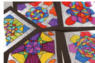
子どもたちの作品の一部。いろいろな形が組み合わせてデザインされ、ステンドグラスのように着色されている。制作には長時間の集中が必要であることが一目でわかる