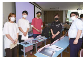
株式会社馬印のチ ーム