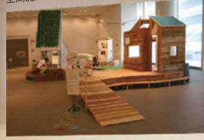
「グランド・カフス博士の庭」(2015、愛知県美術館) 特別展「芸術植物園展」に関連した複数のプログラムを企画実施 空間デザイン：L PACK. 空間施工：ミラクルファクトリー