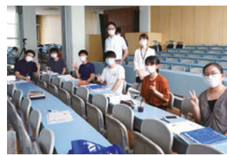
シヤチハタ株式会 社のチーム