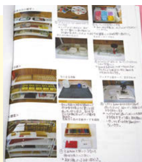
モンテッソーリ教具がたくさん。しかし、そもそも教具には、0～3歳向けのものが少なく、職員らにより手作りされているものも多い