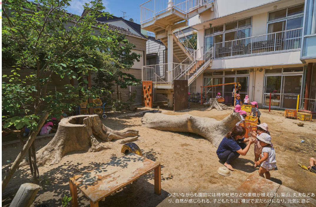
小さいながらも園庭には柿や枇杷などの果樹が植えられ、築山、丸木などあり、自然が感じられる。子どもたちは、裸足で泥だらけになり、元気に遊ぶ