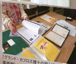
「グランド・カフス博士の庭」(2015、愛知県美術館) から「新種植物押葉記録」。夏の特別展「芸術植物園展」に合わせて行われたプログラム。花びらをコラージュして新しい植物を創り出す