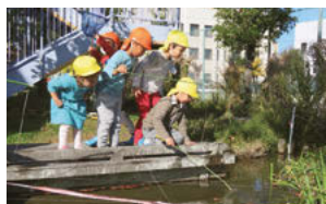
園舎の裏側にはビオトープとして小川と池があり、ザリガニ釣りをはじめ、さまざまな生物と触れ合うことができる

先生たちは、やらせる保育ではなく、子どものやりたいことを伸ばす、子どもが自分の遊びを見つけられる、のびのびとした環境にしたいと話合っています。