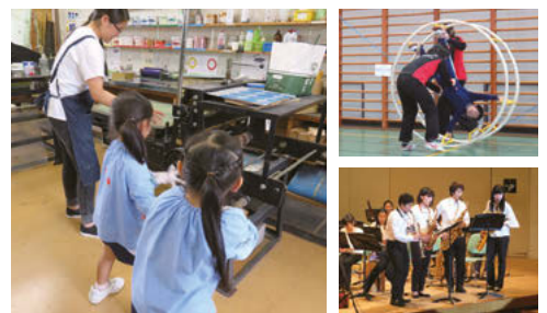
大学に隣接するという地の利を生かし、園児が大学へ赴くこともしばしば。西キャンパスでのワークショップや演奏会の鑑賞など、いろいろな体験ができることもクリエ幼稚園の魅力となっている