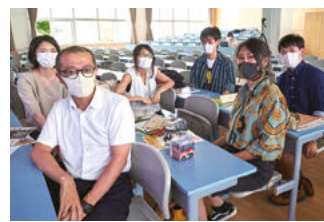
大同至高印刷株式 会社のチーム