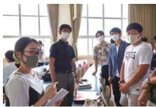
森松産業株式会社 のチーム

今回のキックオフミーティングは、3密を避けて大教室で行われましたが、今後は基本的にオンラインで講義を行い、Facebook上で状況報告、7月中旬に状況報告の中間チェックで集まり、8月上旬にシヤチハタ株式会社様 大会議室での最終審査を行うという予定となっています。どんなアイデアが出てくるか、期待がふくらみます。