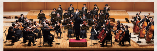
オーケストラ 名古屋芸術大学フィルハーモニー管弦楽団

埼玉県さいたま市出身。東京藝術大学音楽学部附属音楽高等学校、東京藝術大学音楽学部器楽科ピアノ専攻卒業後同大学大学院修士課程修了。その後渡伊、ミラノ・スカラ座研修所コレパティトゥアコース、またミラノ市立クラウディオ・アッパード音楽院指揮科修了。「第3回チェルカスキー国際ピアノコンクール」チェルカスキー特別賞。「第23回リナサラガッロ国際ピアノコンクール」バッハ特別賞。「第13回アントニオ・ナポリターノ国際ピアノコンクール」第1位。「第1回クライスレリアーナ国際ピアノコンクール」第1位。「第32回バルセシア国際音楽コンクール」第3位。他国内外のコンクールにおいて、優勝入賞多数。NPO法人芸術・文化若い芽を育てる会奨励賞受賞。ヨーロッパ、アジア日本各地でリサイタル室内楽コンチェルトソリストとして演奏を行う。また、ミラノ・スカラ座「はじめに音楽、次に言葉」、「ジャンニスキッキ」、「リゴレット」子供のための「チェネレントラ」、上海・上音オペラハウス「魔笛」等で、アシスタントを務める。指揮者としては、Mdi アンサンブル、ミラノクラシカ室内管弦楽団等を指揮する。