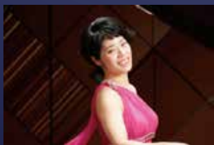
上原 彩子 (Pf.) 芸術学部芸術学科 音楽領域 特別客員教授