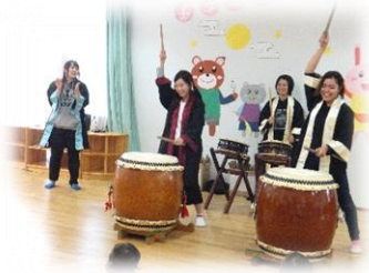
太鼓演奏 ～祭～ 和太鼓部「笑和」の学生

【芸大祭】 11月2日(金) 学生による「にこにこワークショップ」を開催しました！