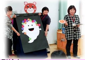
大型絵本 「ばけばけばけばけばけたくん」 ワークショップ指導員