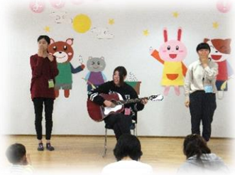
ギター演奏に合わせた手遊び 「あわわわ～」「ゆびにんぼう」 人間発達学部2年生