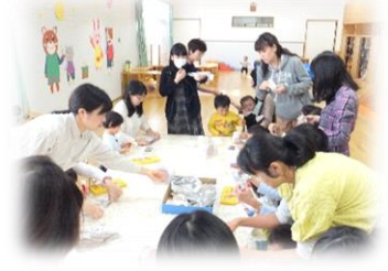
親子で紙コップクラッカー作り デザイン学部4年生