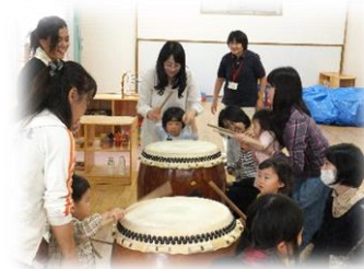
子ども達も太鼓を打ちました♪