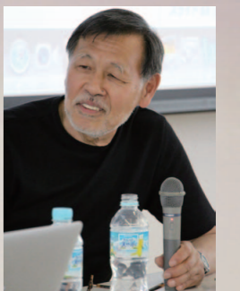
桑山忠明 アーティスト/2013年度 名古屋芸術大学美術学部特別客員教授

名古屋芸術大学 Art & Design Center 〒481-8535 愛知県北名古屋市徳重西沼65番地 TEL [0568] 24-0325 FAX [0568] 24-2897