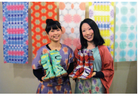
卒業生のまり木綿