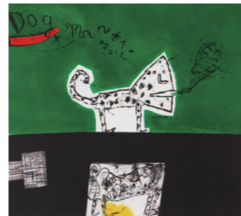
吉岡弘昭「緑色の中の犬」 size:30×40cm

日本のドライポイントの第一人者であり、本学美術学部版画コースの非常勤講師でもある画家の吉岡弘昭氏の2013年秋に予定されている「カタログ・レゾネ」(阿部出版)の出版を記念した展覧会です。吉岡氏の銅版画を展示する他、吉岡ワールドを楽しく魅せるインスタレーションなどが予定されています。