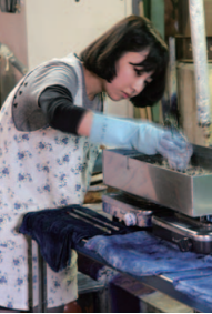
板で縮めた布を染色