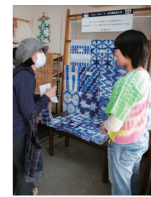
張正ショップで藍色の手ぬぐいを販売

2013年6月1日、2日の両日、第29回有松絞りまつりが開催されました。この有松絞りまつりで、デザイン学部テキスタイルデザインコースの学生たちは、地場産業との連携授業で制作した手ぬぐいを販売しました。