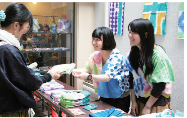
ATSUMARIショップでカラフルな手ぬぐいを販売