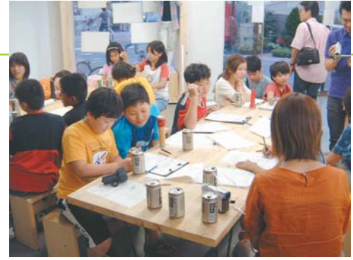
ワークショップの導入。N/N (エヌツー) で子どもたちに内容の説明を行う。