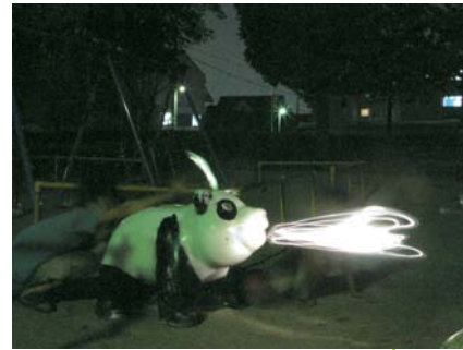
懐中電灯とデジタルカメラを使用。光の軌跡が絵となるように、カメラの露光時間を「長く」設定。公園のバンダが火を噴く怪獣に!