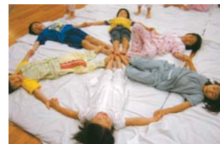
天井と同じ形だね!

緒に寝転がると、六角形だということに気付く、6人で手をつないで寝転がって、形を作って遊んでいます。「特別」ということが大好きな子どもたち。お泊り保育でしかできない、年長さんだけ特別! 今日だけ特別! という特別な思い出がたくさんできたお泊り保育でした。