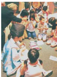
ボストン美術館での、子ども達との触れ合い