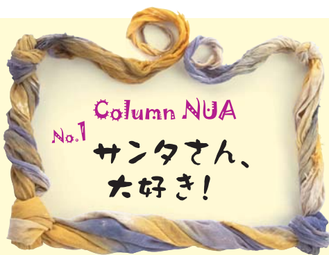
デザイン学部 教養部会 准教授 萩原雄一