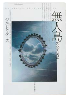
ジル・ドゥルーズ 著「無人島」 装丁デザイン：戸田 ツトム 河出書房新社 表紙写真：檀田 珠実