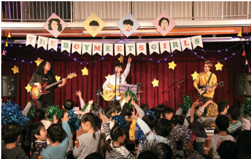
撮影協力：名古屋芸術大学附属クリエ幼稚園