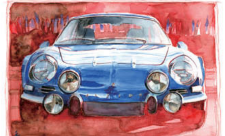
Alpine A110 1961-77

ど、安全基準の問題とポリューション（公害）の問題とかが厳しくなりました。少なくとも内燃機関であれば、エアクリナーとマフラーは大きくなるしかないんですよ。どうやってボディの中に入れ込むの、みたいな話なんですよ。