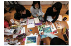
ムードボードの作成中

る場所が必ずあるはずと説明しました。 引き続き、7名ずつ2つのグループに 分かれた学生らが、ブランドの対象と なる顧客(パッチャルカスタマー)を想 定、コンセプトやカラーを話し合い発 表しました。2つのグループは、それぞ れブランド名を決め、コンセプトやメ ージするものを話し合い、それぞれの グループでムードボードを作成しまし た。ムードボードは、ボードにイメージ に合う写真の切り抜きなどを貼り付け、 グループでデザインのイメージをより