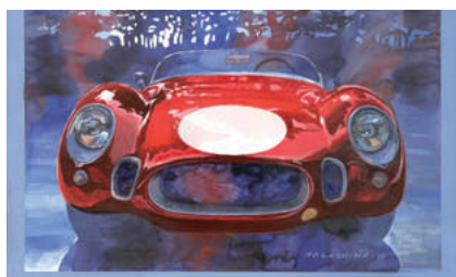
表紙の写真 [O.S.C.A.MT4 CA.1950] イラスト 永島譲二 著作「ヨーロッパ自動車生活」のために描き下ろされたイラスト。