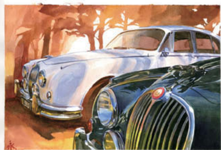
Jaguar Mk II 1959-1969

普通にしてるだけです。いろんな意味で日本はちょっと特殊だと思うんですよ。一度海外に出ると日本がやっぱり特殊だということがよくわかると思います。例えば、今の質問とは、ちょっとズレますが、日本で海外のニュースを見るでしょ、そうするとそれが世界だと思わわけです。政治だとか外交だとか、カリフォルニアで山火事あったと聞くとそれが世界だと思っちゃう。実際に、カリフォルニアで山火事を見ようと思つたらわざわざそこへ行って見ないと、カリフォルニアに住んでる普通の人にとってはなんの関係もないことなんです。そういうふうにニュースというのはいろいろ誤解を生むものです。イランとイラクはすごく仲が悪いということですが、僕のスタジオにはイラン人もイラク人も両方いて一緒に働いてるわけですが、なに一つトラブルはありません。人と人との交流、ある