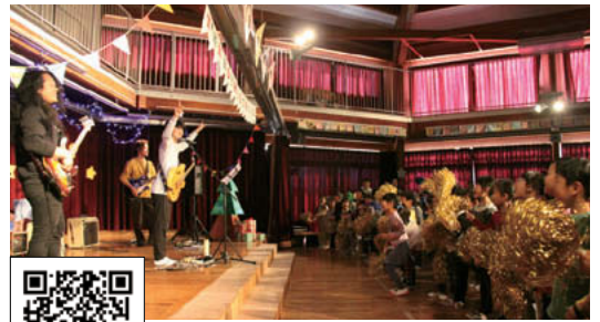
「THE BOY MEETS GIRLS ライブ inクリエ幼稚園」 2018.12/19 お兄さん達と一緒に歌って踊って ジャンプして、とっても盛り上がりました!!