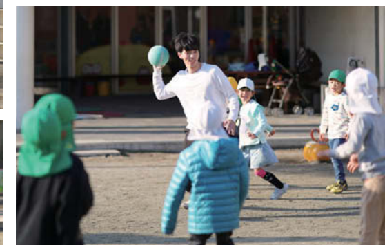
自分が幼稚園のときにいた先生が好きでした。可愛かった。思い出補正が入ってるかもしれないですけど(笑)