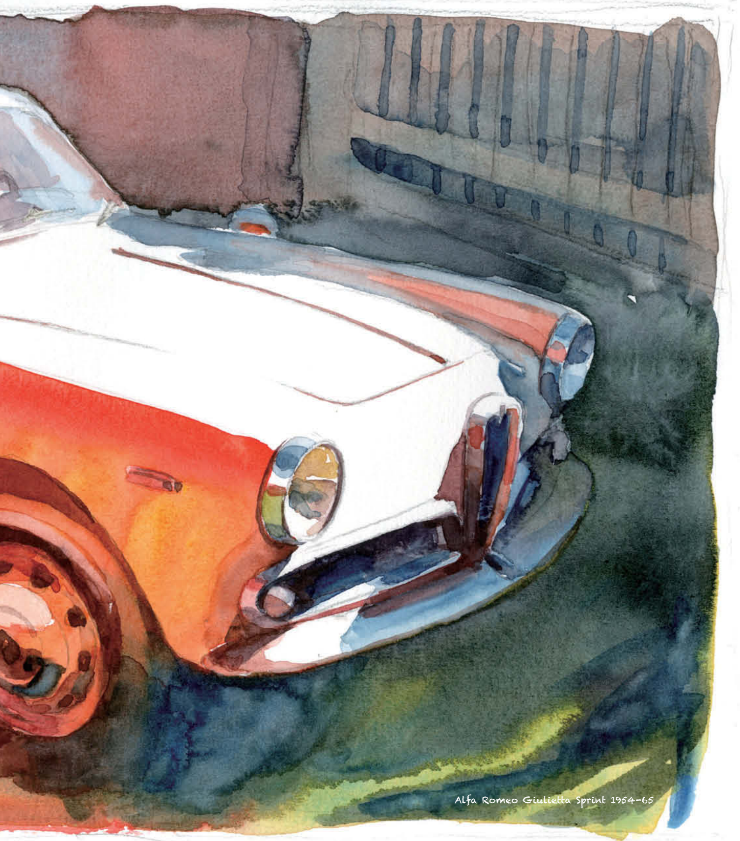
Alfa Romeo Giulietta Sprint 1954-65