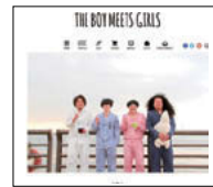
ザ・ボーイミーツガールズ http:// theboymeetsgirls.com/

つも得意じゃなかったし勉強も好きじゃない、自分に自信の持てることがなかったんですけど、ギターを持って『これだ』と部屋にこもってギターの練習ばかりしていたという。高校に入りバンドを組んだ。多くのバンドが人気曲のコピーをする中、オリジナル曲にこだわった。「うちにMacがあって、作曲ソフトが入っていることに気が付いたんです。その存在を知って、ギターをつないで録音できるし、自分で録音して曲を作ることを黙々とやっていたね。高校時代のバンドは、僕はボーカルをやらずギターだけ、でも僕が作った曲をやるバンドでした。曲を作ることが楽しくて、人気バンドのコピーには興味なかったですね。」