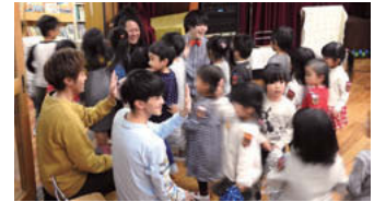
入り口は広くということを意識しています。自分もポ ップスが好きだったということもあって、洋楽とかも聞き ますが、結局、JPOPだったりジャニーズの曲だったり、 つくくさんの作った曲とかに戻ってきてます。