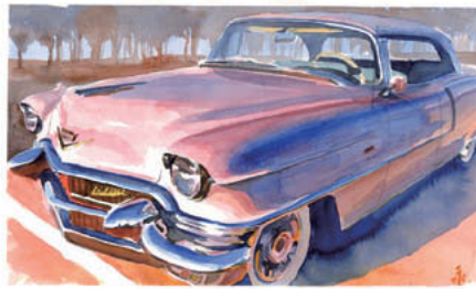
Cadillac Coupe de Ville 1954