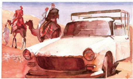
Peugeot 404 Pick-Up