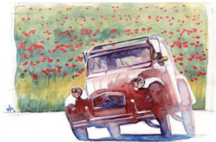
Citroen 2CV 1949-90

いは一緒に職場で働くことは、ニュースで見るような外交問題云々と、実際はなんの関係もないことなんです。例えば、この人はフランス人だから少し嫉妬深いかも思ったりしますよ、面倒くさいところがあるかなと思ったりもします、でも、結局つまるところはその個人がどうなのかということですから。