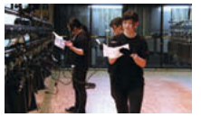
舞台、音響、照明、衣装など、舞台制作を幅広く学ぶ。基礎を座学で学びながら、ホールでの演技演習を日々重ねている。

スタッフとして音楽監督の下につきました。音楽監督とキャストの間に入ってその連携を手伝ったり、楽譜を管理したりしました。