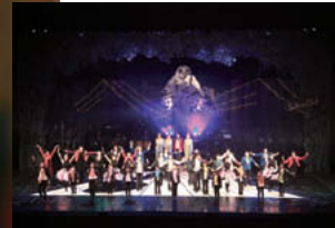
飛騨・童話会議 第10回飛騨センターオリジナルミュージカル公演「星の王子さまによろしく」