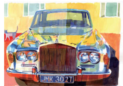
Rolls Royce Silver Cloud 1966

て、安くタクシーもある。それでクルマを維持するお金を考えたら、ないほうが便利という感じもします、名古屋は別かもしれませんが。パリの郊外に住んでいたことがありますが、市内に行くときにはクルマで行ったことはないですよ。