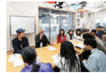
講義を耳を傾ける学生たち