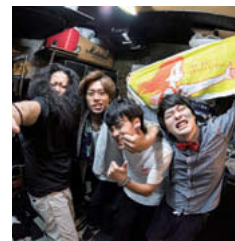
ちょっと古いですけど LOVEマシーンとか、 大人も忘年会で歌うし 子ども歌って踊れる し。いろんな届け方が あって、大人から見れ ば現代を辛辣に歌っ ていたり、子どもとし ては言葉遊びが楽し く歌うのが楽しい。い ろんな角度から楽し める曲を作ろうと思 いで作っています。