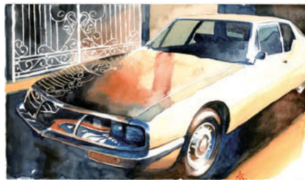
Citroen SM 1970-76