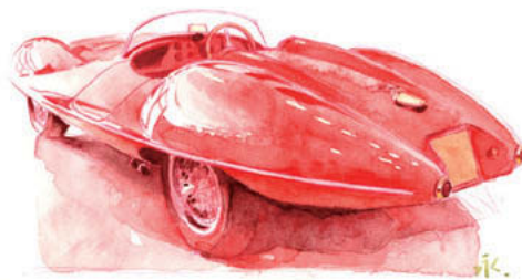
Alfa Romeo Disco Volante 1962-63