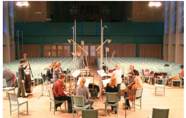
教会でのレコーディングの様子

デジタル技術の発達は、音楽の編集を可能にした。ポピュラー音楽の CD で、Vocal を修正してあることは周知の事実とも言えるが、オーケストラでも状況は同じ。ドイツでは、トーンテクニクという肩書きがオーケストラの一員としてクレジットされるという。