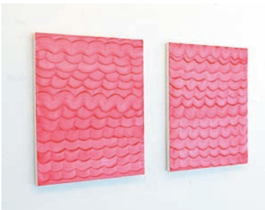
『waves』 各 41 × 32 cm oil on canvas 2009年

うすると作品のイメージが固定化されてきて、自分でもシステマチックに作品が作りやすくなっていくんです。こうして何十年もやっていけば、アーティストとしていいんじゃないか、と思いました」けれども、少しずつ考えには変化ができた。もっといろんな可能性があるんじゃないか、閉塞感が自分のやってきたことを疑わせた。こんなとき出会ったのが、タイの古陶磁だった。偶然、展覧会に誘われて訪れたタイ。田舎の古い窯跡で陶片を拾って歩いた。「宋胡録」(「スンコロク」サワンカロークの音訳)として桃山や江戸時代の茶人にも珍重された古陶磁の形状や絵付けの伸びやかさに魅せられた。「最初は全然興味がなかったんですけど、ヨーロッパにはないじゃないですか。こういうのを見たときの面白さに、自分も、もうちょっと伸びやかにやっていってもいいんじゃないかなと」