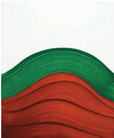
『mountain』 55 × 45 cm oil on canvas 2009年