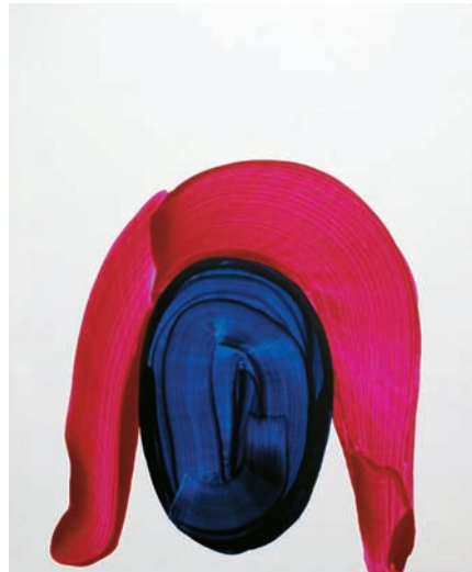
『head』 65 × 55 cm oil on canvas 2009年

うすると作品のイメージが固定化されてきて、自分でもシステマチックに作品が作りやすくなっていくんです。こうして何十年もやっていけば、アーティストとしていいんじゃないか、と思いました」けれども、少しずつ考えには変化ができた。もっといろんな可能性があるんじゃないか、閉塞感が自分のやってきたことを疑わせた。こんなとき出会ったのが、タイの古陶磁だった。偶然、展覧会に誘われて訪れたタイ。田舎の古い窯跡で陶片を拾って歩いた。「宋胡録」(「スンコロク」サワンカロークの音訳)として桃山や江戸時代の茶人にも珍重された古陶磁の形状や絵付けの伸びやかさに魅せられた。「最初は全然興味がなかったんですけど、ヨーロッパにはないじゃないですか。こういうのを見たときの面白さに、自分も、もうちょっと伸びやかにやっていってもいいんじゃないかなと」