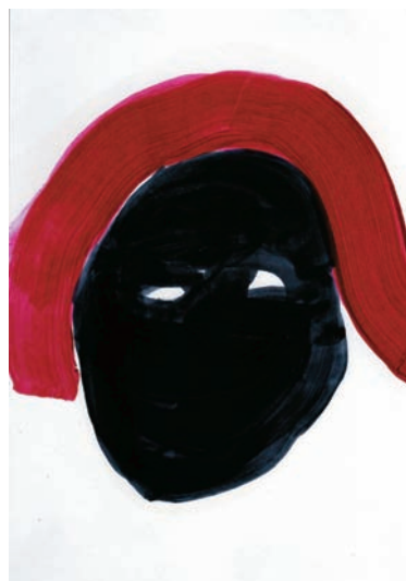
『dark face』 30 × 21cm oil on paper 2009年

学生たちには、自由であること不自由さのあること、この2つのバランス感覚が大切だと教える。「美術は本来自由なものなのに、絵を学び始めて上達してくると、だんだんとある意味、不自由になってくるんですよ…。中学生とか高校生くらいになると知識やテクニックも少しずつ向上する反面、自由に描けなくなる。小学校低学年までの頃は、絵を描かせるともものすごく速いし、無心でどんどん描ける。それが、いろんなものを学んでいくうちに、その自由さが失われ、ある意味不自由になっていくんですね。そうして、絵が痩せていく。面白くなっていくことがあるんですよ。自由と不自由さを、いかに自分自身の中でバランスを取って作品に出していけるか。それができる人はアーティストとして魅力のある作品を制作できるでしょう。半分子供のような感覚を持っていながら、でも、片方で鋭い