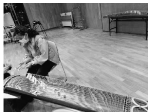
写真14 指導を受ける学生