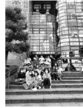
写真8 昭和日常博物館前