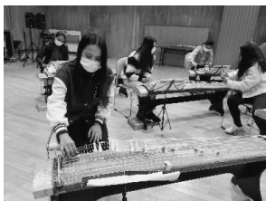
写真13 教えあう様子