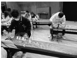
写真12 練習する学生達

レポートは留学生別科の廊下に貼り出し通る人に見てもらい、別科の学生がどんなことをしているのか知ってもらう良い機会となった。うまく書けているという意見をいただき、学生達のモチベーションアップにもつながった。