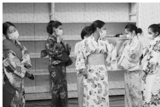
写真3 着付けてもらう学生達

体験と同時に自分の国の伝統的衣服との比較もさせた。自分の国の文化を日本語で表現する作業は与えられた情報を日本語にすることよりも、発信したい・伝えたいという意欲がより強くなると考え、日本事情の授業の中で繰り返し学生に挑戦させる課題である。しかし、自国の文化でありながら、日本語でどう表現するのか、カタカナでどう表記するのか、わからない学生がほとんどである。一つ一つを筆者が手伝ってやらねばならないが、自主的に筆者に質問する回数が増える作業であり、日本語で表現するということに対して能動的になるいい機会となった。