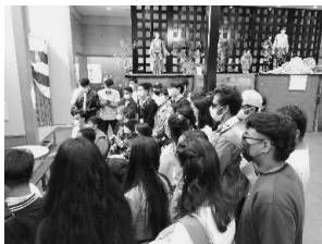
写真9 からくり館見学