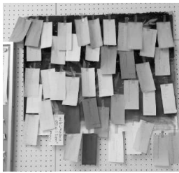
写真1 2022年度生七夕飾り

比較させた。次の回で七夕について詳しく説明し、絵本の読み聞かせを行った。さらに、学生に聞いた話をもとにあらすじを自分で書かせることで内容を深く理解させた。その結果、天の神様に「願い事」を聞いてもらうという七夕の状況も理解しやすくなった。さらに、文型「～ように」を使ってそれぞれの願い事を考えさせ短冊に記入させた。予算が限られている中、できることは少ないが、願い事を考えるところから、貼り付けるところまで楽しそうに取り組み、自分の作品を写真に撮ったり動画を撮ったりしていた。