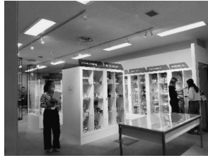
写真7 常設コーナー