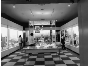
写真6 夏の特集コーナー

発表そのものに慣れていない学生もおり人前で話すことに慣れるため、一年間の授業を通し段階を踏んで人前で表現する機会を設けた。