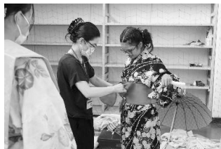
写真4 帯を結ぶ筆者