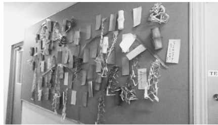
写真2 2021年度生七夕飾り