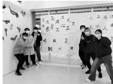
写真17 留学生別科作品展