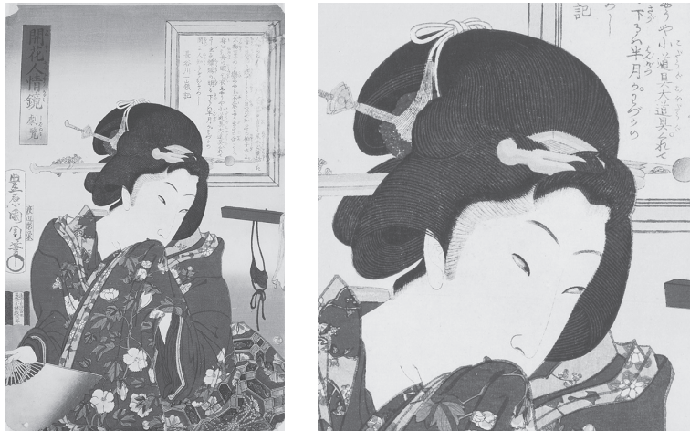
図11 開花人情鏡 劇覧 (右：部分)

判明する。「割店」の女性の目(図8部分)を見ると、目の上部は太い線で下部は細い線で表現されていることがわかる。この表現自体は国周が描く女性像の概ねに当てはまる特徴であり、また幕末の美人画、たとえば溪齋英泉「今様美人十二景 おとなしそう」(図10・但し部分、文化～天保年間/1815～24)にも既に用いられているものだ。目の内側にまつ毛を描き込む表現もまた同様である。しかし「割店」(図8部分)と比べると、こちらは目の輪郭をすべて薄墨で表現していることに違いがある。これによって目許から受ける印象がぼんやりとしてしまう。では本シリーズの他作品はどうだろうか。同じく少々年配の女性を描いた「船客」(図9)から受ける印象はかなり違う。女性が楽しそうであることが画面から伝わってくるのである。目許(図9部分)を観察すると、目の上部と下部の線描の差異が明確であって、「割店」の女性の目(図8部分)よりも上部の線が黒く引かれていることがわかる。表情から受ける印象の違いは目許の表現の差異であり、言わばアイライン効果の有無と言ってよいだろう。さらに明確な違いを見せるのは「劇覧」(図11)である。目の上部の線が黒々と引かれることによって、俗に言うところの「目力」を感じることができる。ちなみに本図の瞳孔の位置にはやや違和感をおぼえるが、これは役者絵「けいせい敷島 澤村田之助」(図2部分)に通ずるものと思われる。