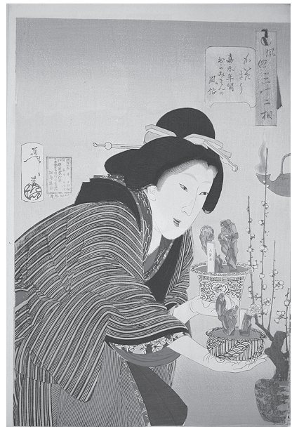
図14 芳年 風俗三十二相 かいたさう

まずモチーフについて述べる。浮世絵美人画の主題として最も多く描かれてきたのは芸妓や遊女といった女性たちであり、年齢に関して言えば今を盛りの若い女性たちであったことは言うまでもない。しかし先にも述べたように、国周「開花人情鏡」（明治11年）や後年の「見立昼夜廿四時」（明治23年）では年齢を重ねた女性を積極的に取り上げており、これは国周美人画の特徴の一つとすることができる。同時期の浮世絵師である月岡芳年の美人画シリーズ「風俗三十二相」（明治21年）には、眉を落とした比較的年配の女性が、ふきのとうと思しき鉢に手に取る「かいたさう」（図14）があるが、これは