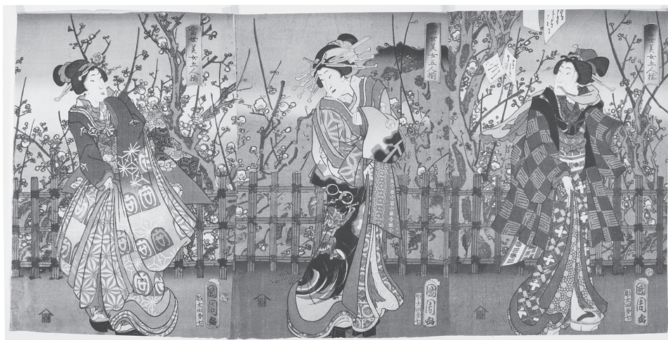
図3 当世美女五人揃