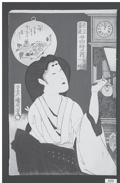
図12 見立昼夜廿四時 午前一時

先行するシリーズ「開花人情鏡」と比較すると、描かれた女性たちの表情がおしなべて穏やかで優しい印象を受けるが、これはやはり目の表現方法によるものだと思われる。たとえば「開花人情鏡 割店」の女性の虹彩と瞳孔(いわゆる「黒目」、図8部分)と本シ