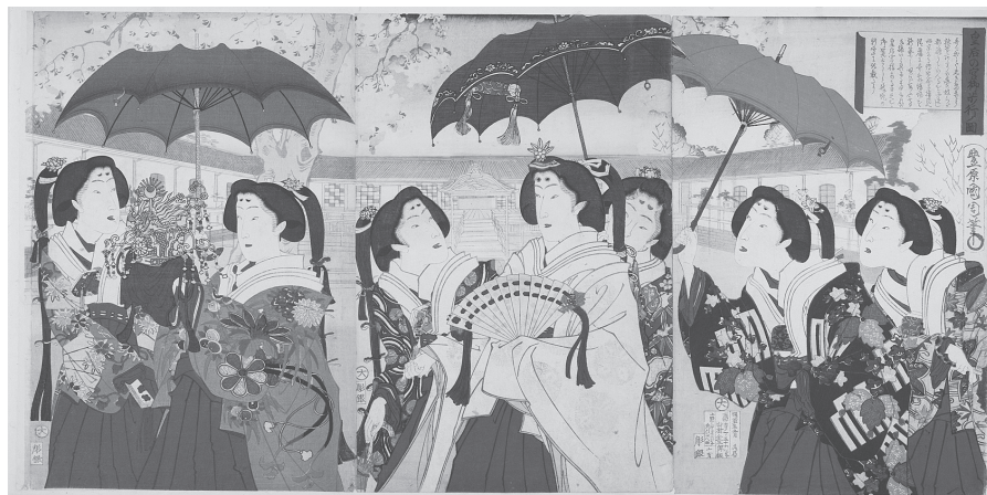
図6 皇后の宮御歩行ノ図

たとえば「皇后の宮御歩行ノ図」（図6・明治10年）には皇后とお付の官女たち、総勢7名の女性が描かれる。お花見を楽しむ一行を描いたものだが、場所はおそらく上野公園。宮中の女性たちの髪型は本来、「おすべらかし（垂髪）」であるはずだが、ここでは大名家の奥方のようなスタイルになっているのはご愛嬌といったところか。公家の女性たちの殿上眉もしっかりと描き込まれる。また鮮やかな青や紫、緑の洋傘を手をしているのも、当時の流行 25) を反映しているが、宮中の女性たちが果たして洋傘を手にしたかどうかはわからない。ちなみにこうした、西洋から入ってきた新しい文物も、当時の浮世絵版画には必ずと言っていいほど描き込まれるモチーフだった。