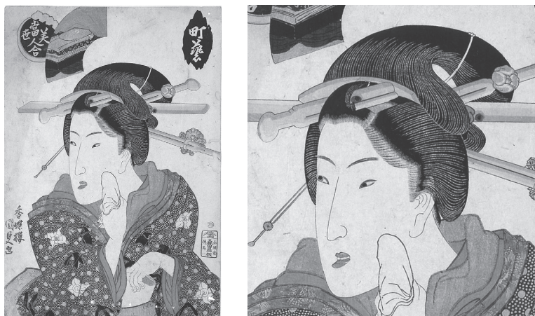
図15 国貞 町芸 (右：部分)

「開花人情鏡」刊行の10年後にあたる。この点においては芳年が国周に追随したと考えるもよからう 30) 。