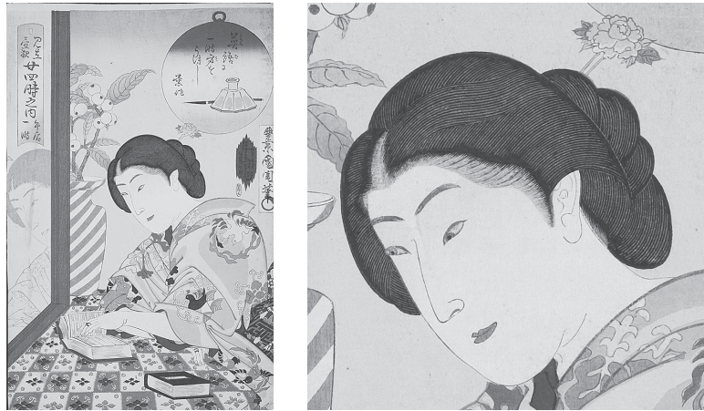
図13 見立昼夜廿四時 午後一時（右：部分）

リーズの「午後一時」（図13部分）を比較してみると、後者が目の輪郭部分と虹彩を明確に描き分け、また大きく描き出しているのに対し、前者は輪郭と虹彩がやや未分明で、かつ虹彩が小さいことがわかる。虹彩部分、つまりいわゆる黒目が大きいほうが可愛らしく目に映るのは現代でも同じこと。女性の顔貌表現において国周が変化を見せていることが判明する。