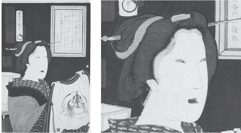
図8 開花人情鏡 割店 (右:部分)