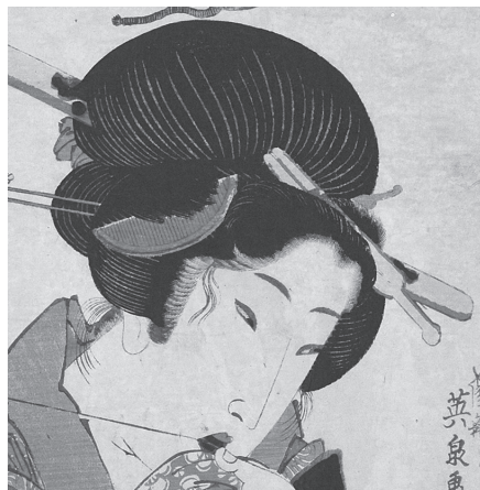
図10 溪齋英泉 今様美人十二景 おとなしそう (部分 顔)