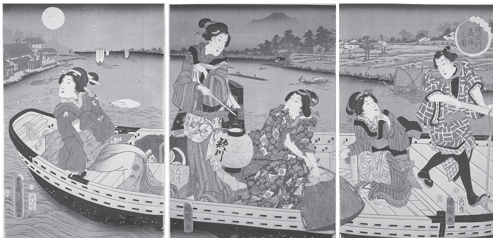
図1 隅田川夜渉し之図

画業の画期となった作品は、明治2年(1869)に版行された一連の大首絵作品である。