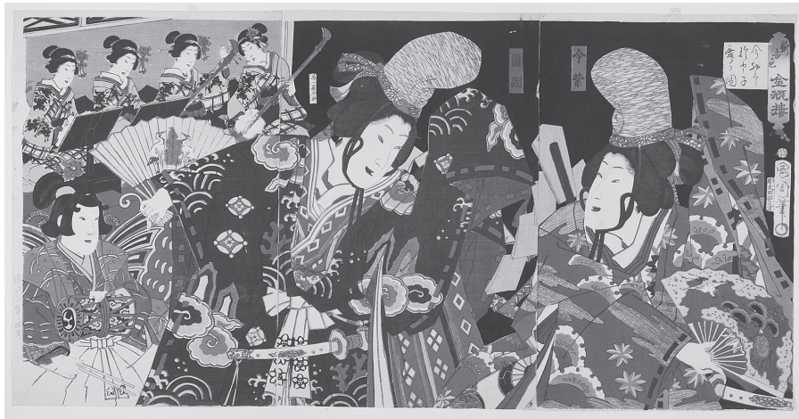
図4 新吉原 金瓶楼